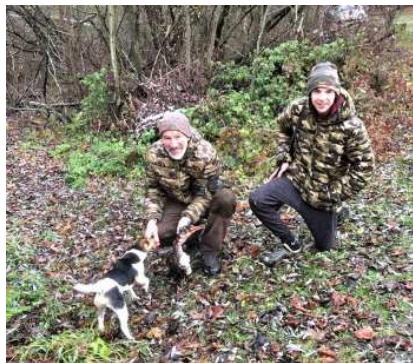
Kormoran-Beute am Moosstockwiesen