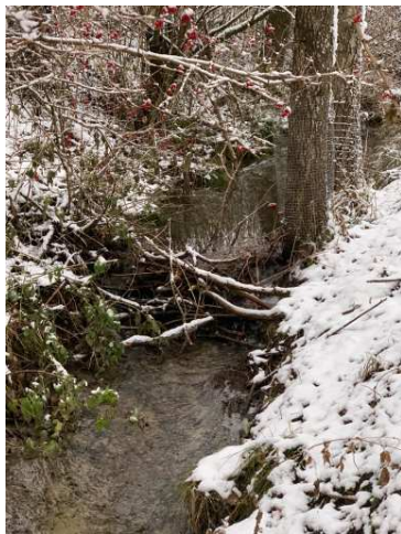
Biber am Schachen – Umlaufgraben